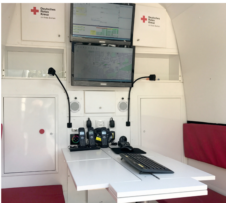
Der Besprechungsraum mit 4 Sitzplätzen, inkl. Arbeits- platz für die Lageführung.

Bitte berücksichtigen Sie alle Angaben, um bewerten zu können, ob der Einsatzleitwagen (ELW) Typ 1 auf Ihrer Veranstaltung eingesetzt werden kann.