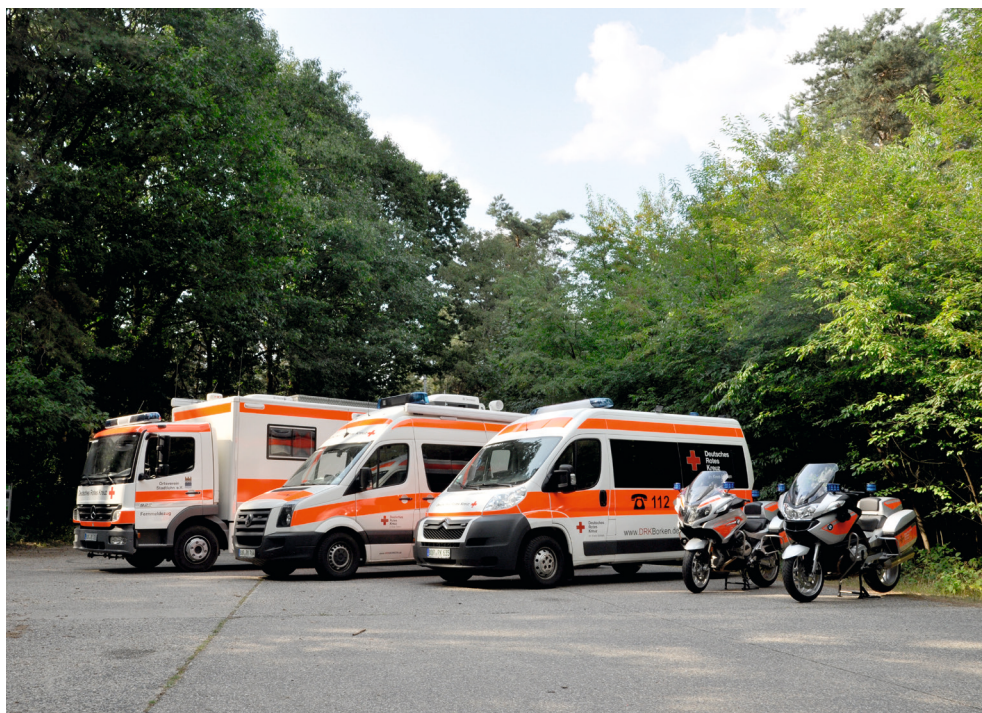
Der DRK-Fernmeldezug Einfach, schnell, kostenneutral